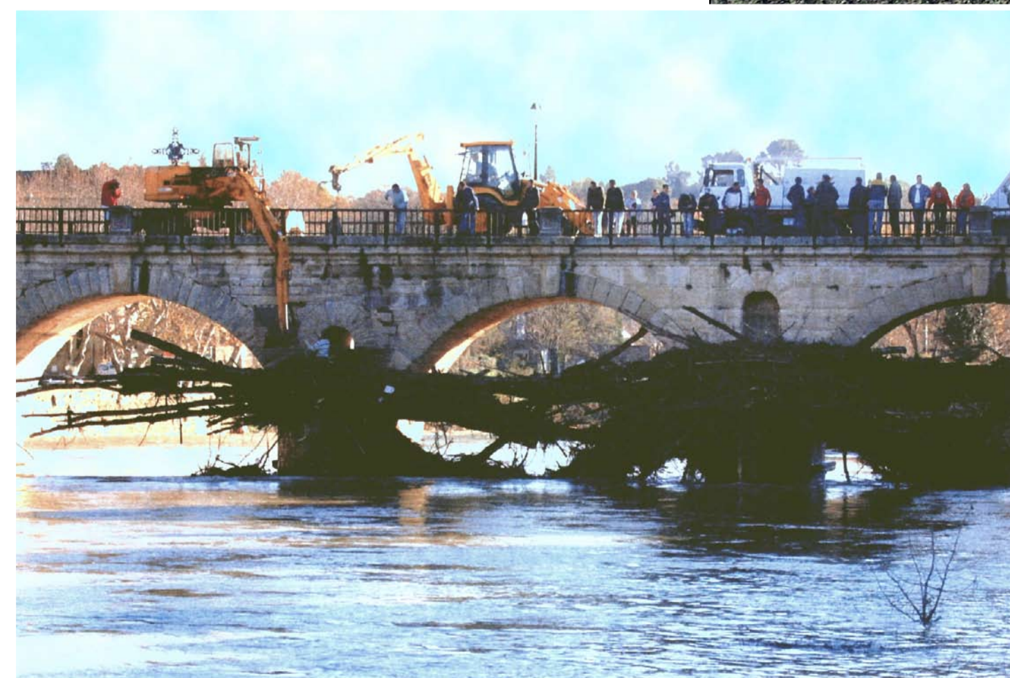
Embâcles accumulés devant le Pont Tibère lors de la crue de Décembre 2002

Peigne à Embâcles composé de 70 pieux espacés de 2 mètres (zone de dépôt des arbres morts et autres obstacles dérivant en période de crue)