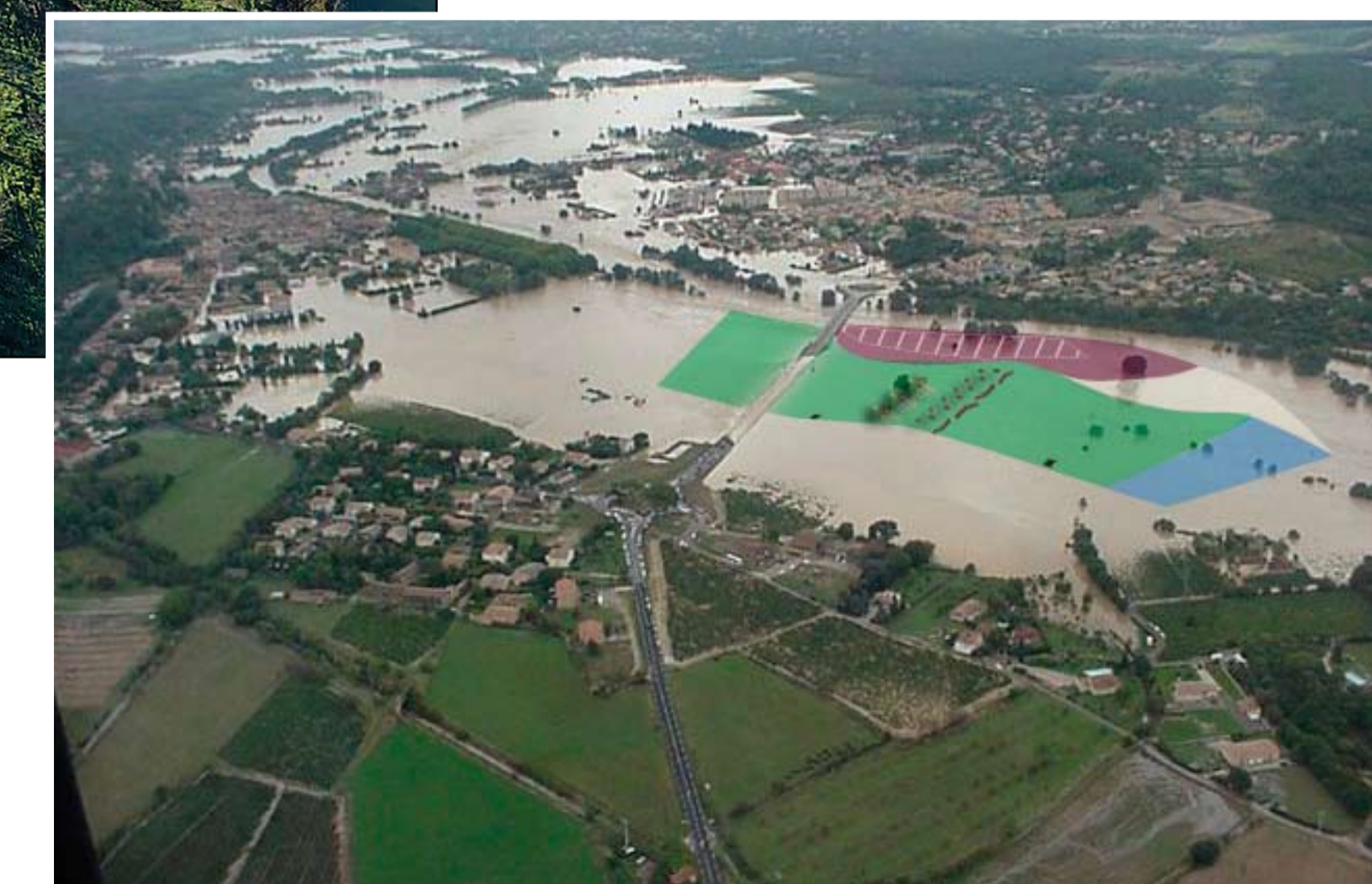
La zone lors de la crue de Septembre 2002