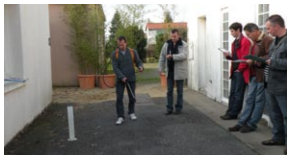
Réglage des pulvérisateurs lors de la formation d'agents communaux, La Forêt-sur-Sèvre (Deux-Sèvres)