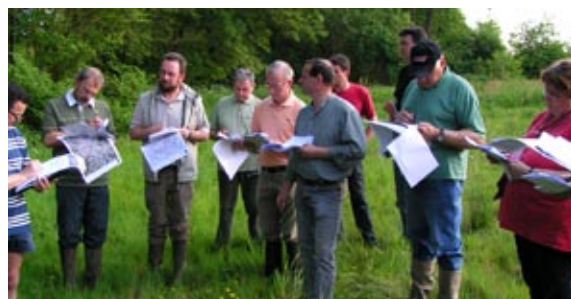
Le groupe local de pilotage sur le terrain.

Il est perçu comme un document d'aide à la décision pour l'aménagement du territoire. L'étude a ainsi rencontré un franc succès sur la commune, et a montré l'importance de la proximité et de la concertation sur les thématiques zones humides et haies.