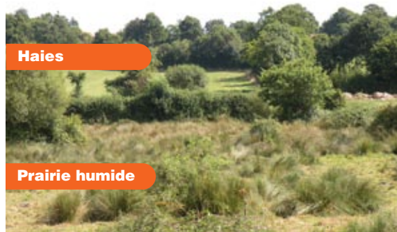
Zone humide à La Chapelle-Largeau.

Au total, 230 personnes ont été contactées et rencontrées, majoritairement les agriculteurs du territoire ainsi que quelques particuliers propriétaires de terrains non agricoles (plans d'eau, terrains de loisirs...). Chaque phase d'inventaire a été suivie d'une réunion publique. Le comité de pilotage a validé le travail et les orientations de gestion le 12 janvier 2009.