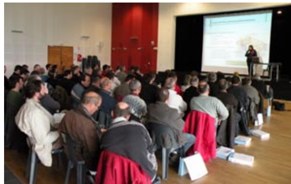
Journée de sensibilisation au Puy-St-Bonnet (Maine-et-Loire)

Plusieurs communes du bassin se sont d'ores et déjà engagées dans cette politique de protection