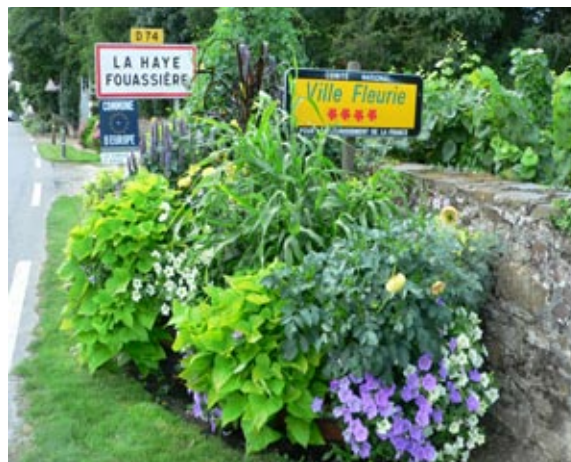
Espaces verts à La Haye-Fouassière