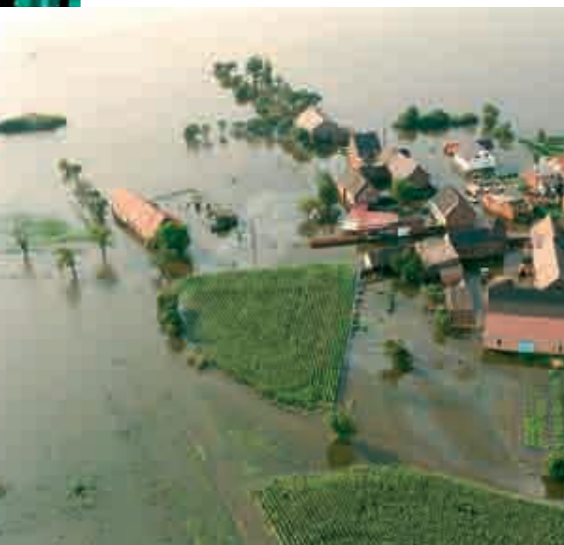
Inondations en Allemagne en 2002.