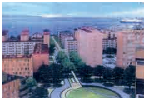
La seule démolition prévue à Ajaccio : le percement de la barre Mancini pour permettre l'évacuation rapide des inondations vers la mer.

ce secteur, sont admis, sous réserve des dispositions générales applicables en secteur ZU, les deux seuls équipements publics du projet concernés par le risque :