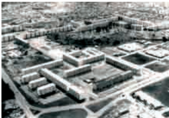
Les grands ensembles de Pointe-à-Pitre.

La moitié de la population de Pointe-à-Pitre (21 000 habitants) est concernée par ce projet ANRU. Ce projet, énorme et stratégique dans sa dimension urbaine, sociale et économique, porte essentiellement sur une forte requalification du parc de logements.