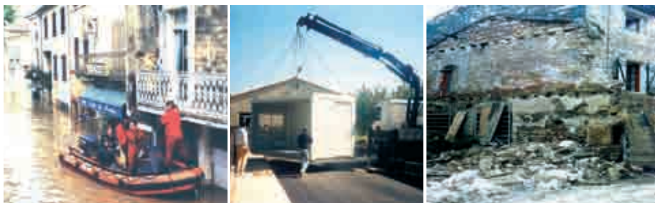
De g. à d. : MOUS d'urgence, octobre 2002 ; MOUS relogement, septembre 2002-mars 2004 ; MOUS réhabilitation, janvier 2003-décembre 2004.

L'association de compétences multiples notamment « risques », « habitat-urbanisme » et « architecture », permet de décloisonner les habitudes de travail en s'appuyant sur des services techniques ayant l'ensemble des délégations. Ce rapprochement entre compétences risques / habitat-urbanisme doit s'effectuer au sein des services de l'État mais aussi au sein des collectivités. De plus, il conviendrait d'associer systématiquement les professionnels de la ville et de l'architecture à la réflexion sur la réduction des vulnérabilités (le traitement des rez-de-chaussée du bâti existant, en cœur de ville, est un exemple de ce rapprochement indispensable).