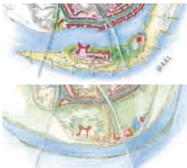
Lent sur le Waal, face à la ville de Nimègue aux Pays-Bas : projets officiel et alternatif pour donner de l'espace au fleuve (programme Ruimte voor de rivier).

Les approches des trois pays étudiés sont très orientées vers la prévention à la source , donc à partir des interventions publiques sur le cours d'eau et sur l'espace public. Ceci tient à l'organisation du droit (responsabilité principale de la puissance publique) et au caractère plus limité des dispositifs d'assurances. L'adoption de mesures de résistance ou de résilience dans l'espace privé sont considérées comme utiles, mais dans l'ordre du « conseil » au particulier (ou pouvant jouer dans la négociation du contrat d'assurance), alors que la planification, la gestion hydraulique sont des devoirs préalables pour les instances chargées de la sécurité.