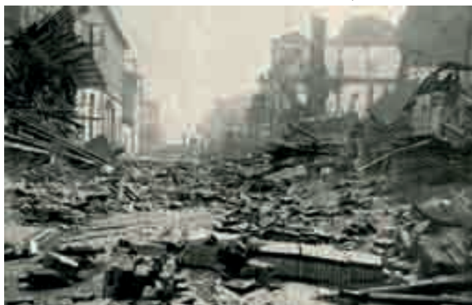
Montauban : la crue historique du 4 mars 1930

Les acteurs sont unanimes à dire que la contrainte d'inondation a finalement été une chance pour le projet, moins onéreux, et plus satisfaisant pour les habitants.