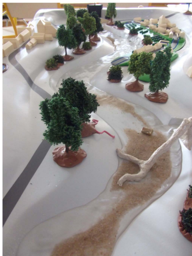
Vue générale en cours d'utilisation