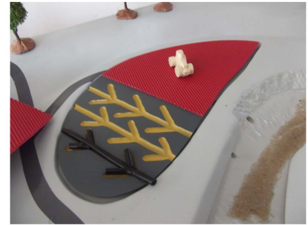
Labours et drainage agricole