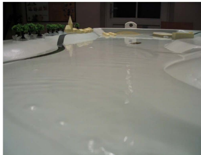
Inondation du lit majeur