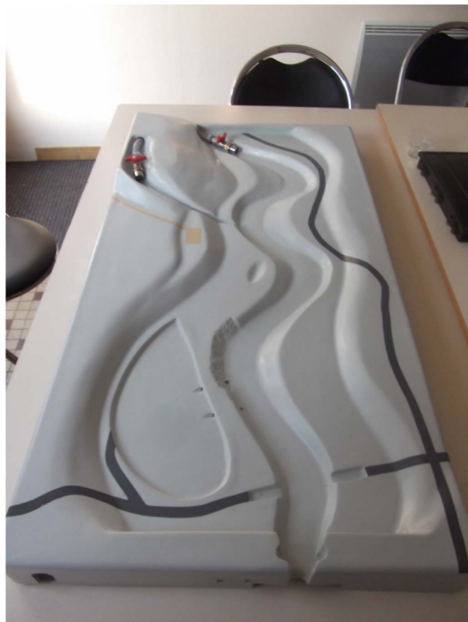
Vue générale du plateau