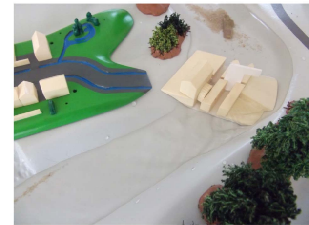
Moulin au fil de l'eau