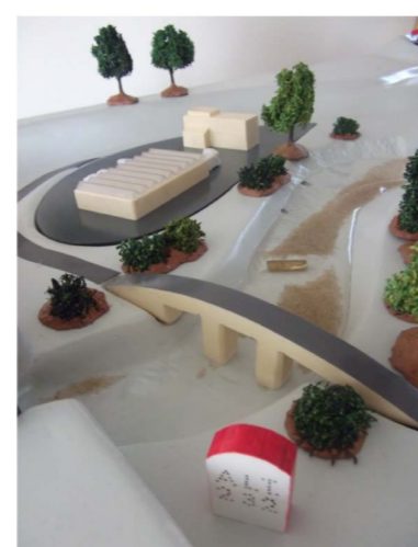
Pont et zone industrielle