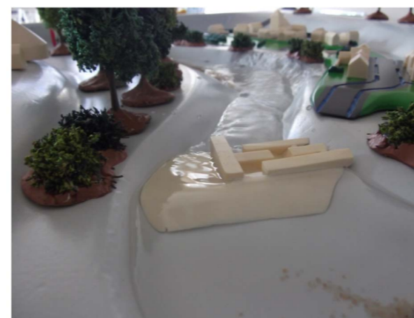
Passe à poissons