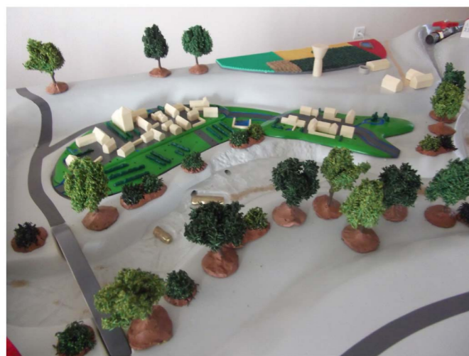
Lit mineur et lit majeur