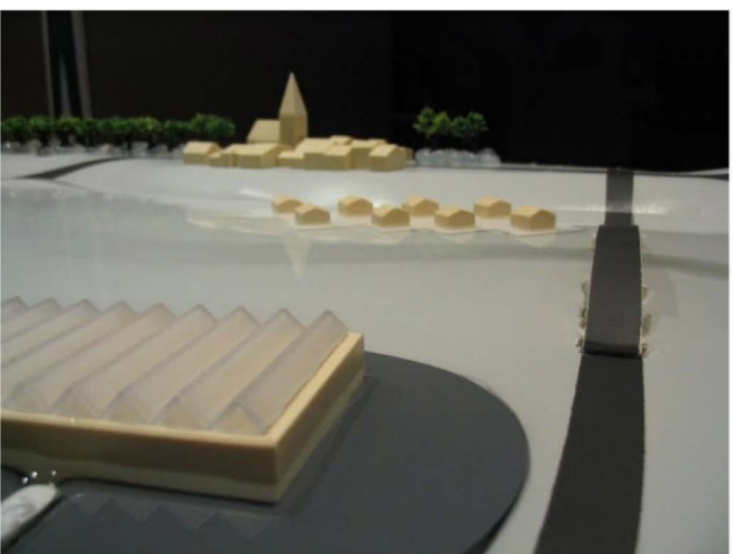
Inondation et aménagements humains